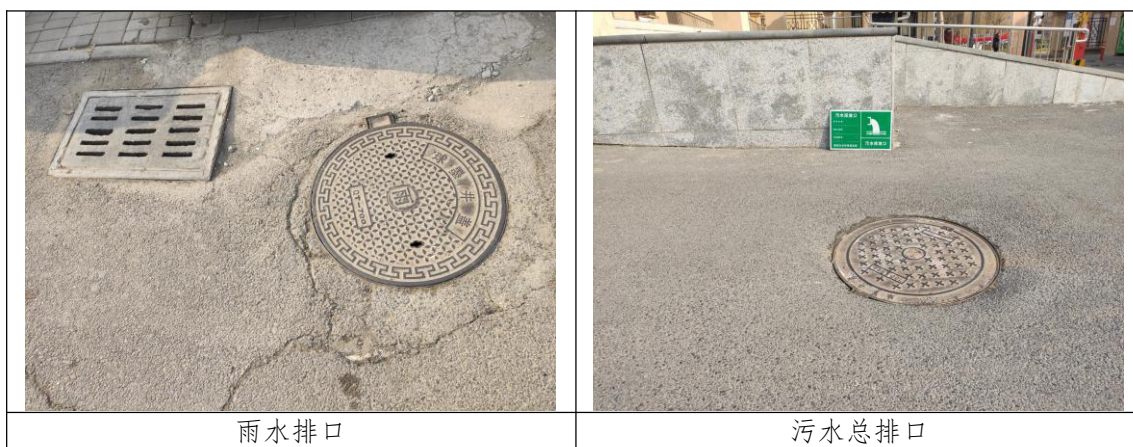
图 4.1.2.1 本项目废水总排口

本项目采用雨污分流。雨水排入市政雨水管网；外排废水主要为居民生活污水，配套学校、幼儿园等的生活污水，配套经营性公建生活污水。配套经营性公建内产生的含油污水经隔油池进行处理，其他生活污水经化粪池沉淀，排入市政污水管网，最终排入天津市蓟州区城区污水处理厂处理。