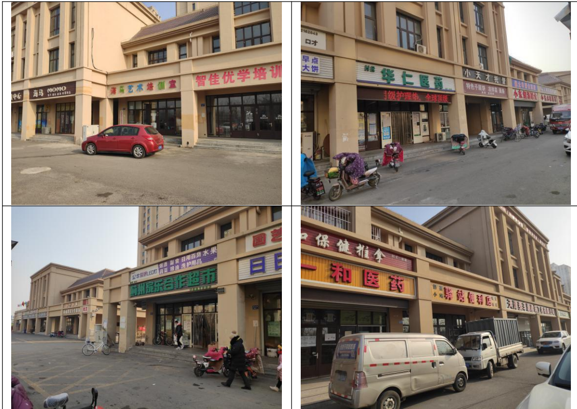
图 3.1.3 地块内入驻商业业态