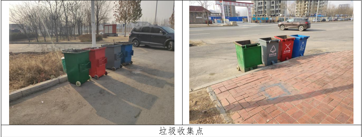
图 4.1.4.1 本项目垃圾收集示意图