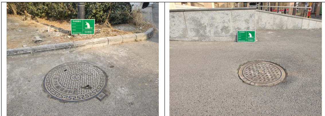
图 4.2.1 废水总排口规范化建设示意图