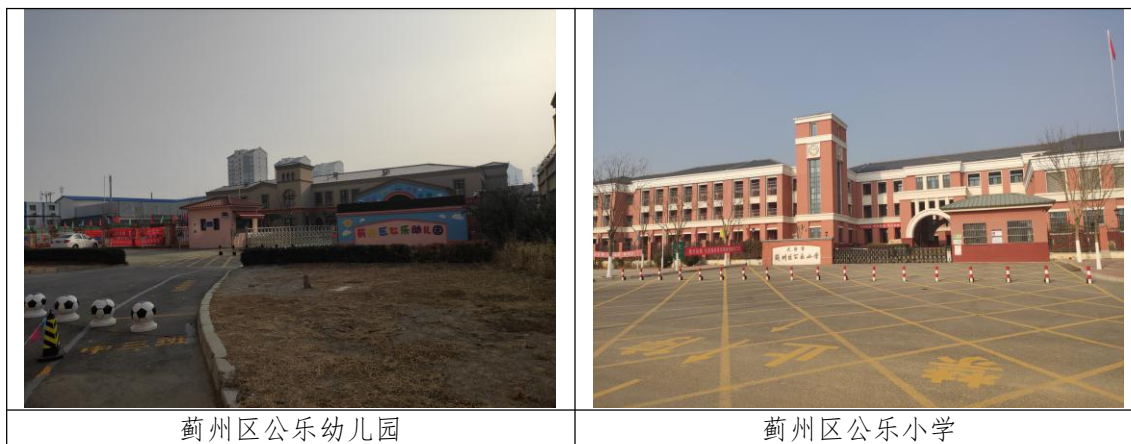
图 3.1.2 本项目配套公建