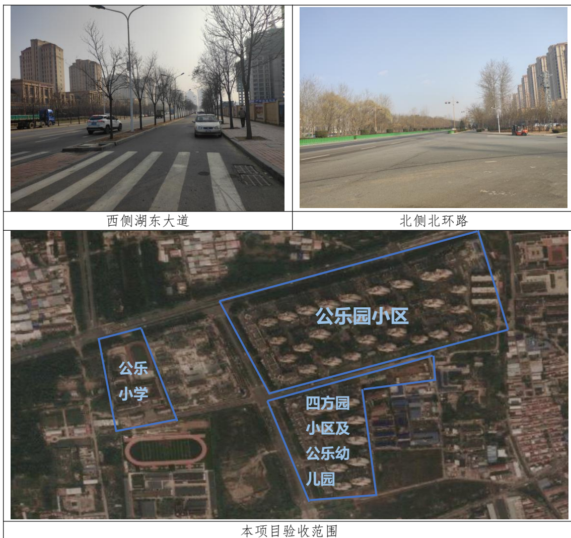
图 3.1.1 本项目验收范围及四至范围示意图

本项目为天津市蓟县新城示范小城镇（一期）B1、B2 地块竣工环保验收项目。本项目位于天津市蓟州区北环路以南，湖东大道以东（东经 E 117. 38977044°；北纬 N 40. 04628946°）。四至范围：东侧为津蓟铁路延长线（水泥石矿专用线，现已不通车）、西侧为湖东大道、南侧为独乐寺大街、北侧为北环路。验收范围及四至如下图所示：