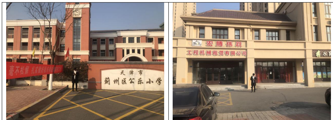
图 7.2.1 噪声现场监测图