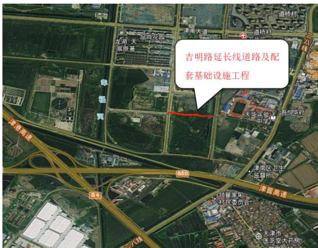
图 1-1 项目地理位置图

天津海河教育园区吉明路延长线道路及配套基础设施工程位于天津海河教育园区 02 单元区块，道路起点与现状雅馨路、终点与现状雅润路相交，项目地理位置图如下图所示：