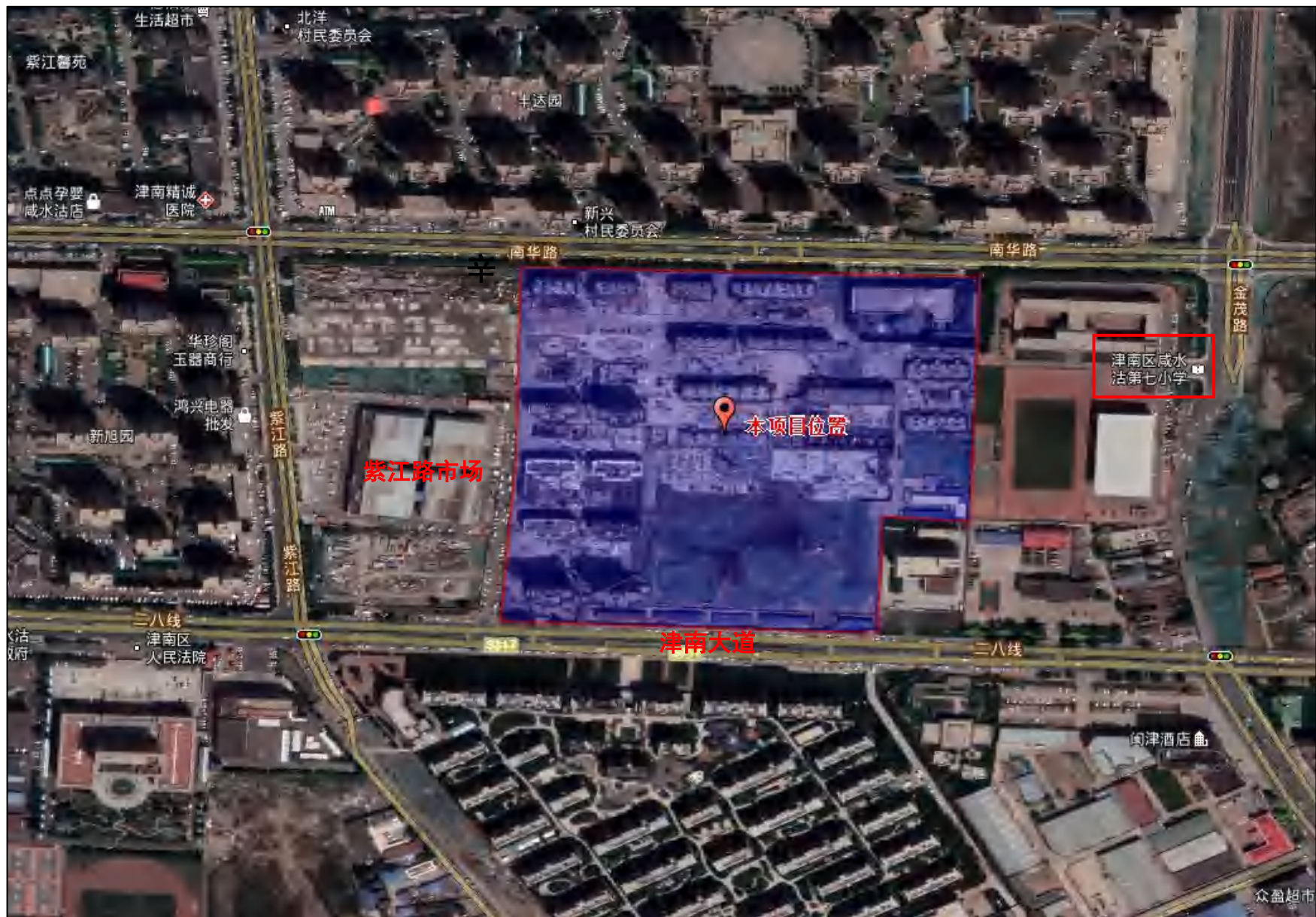
附图一 项目区地理位置图