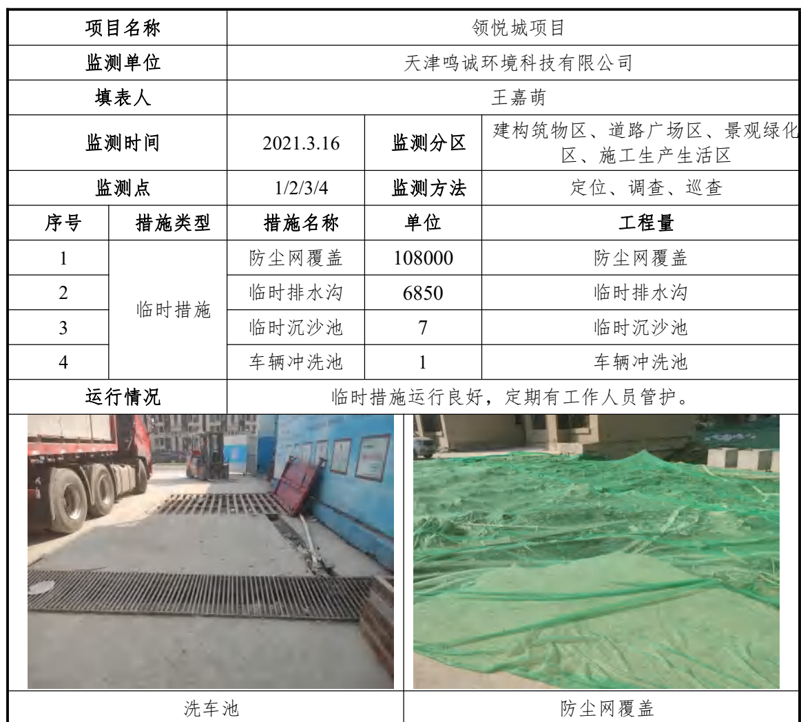
表 2-1 监测记录表