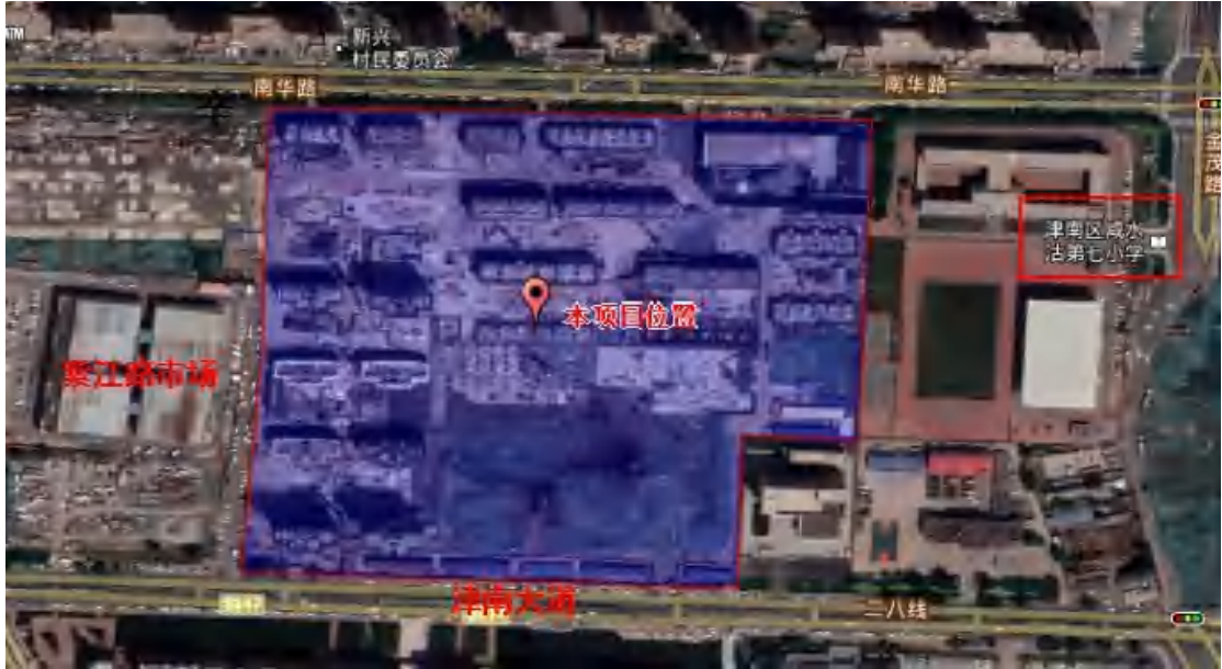
图 1-1 项目地理位置图