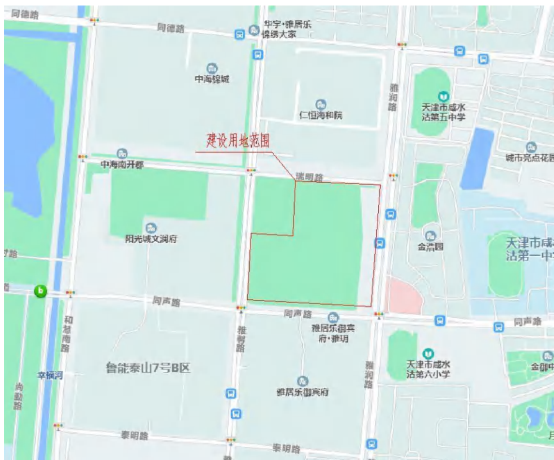
图 1-1 项目地理位置图

天津海河教育园区南开学校雅润路校区工程位于天津海河教育园区一期工程规划范围内，东至雅润路，南至同声路，西至雅馨路，北至瑞明路。项目地理位置图如下图所示：