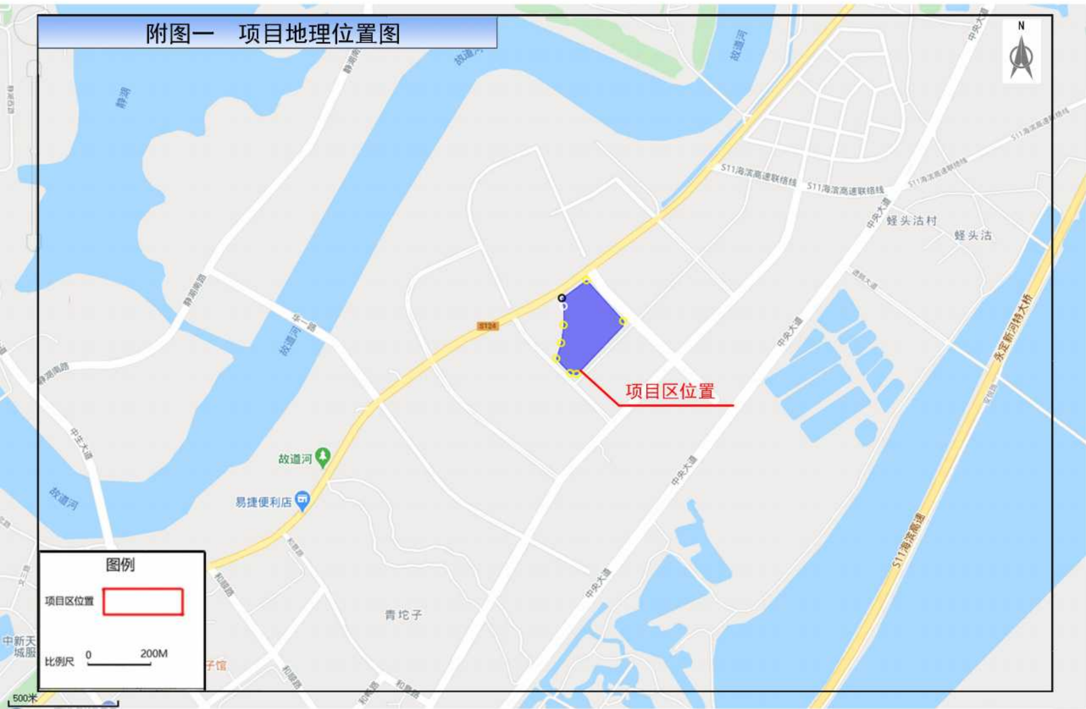
附图一 项目地理位置图