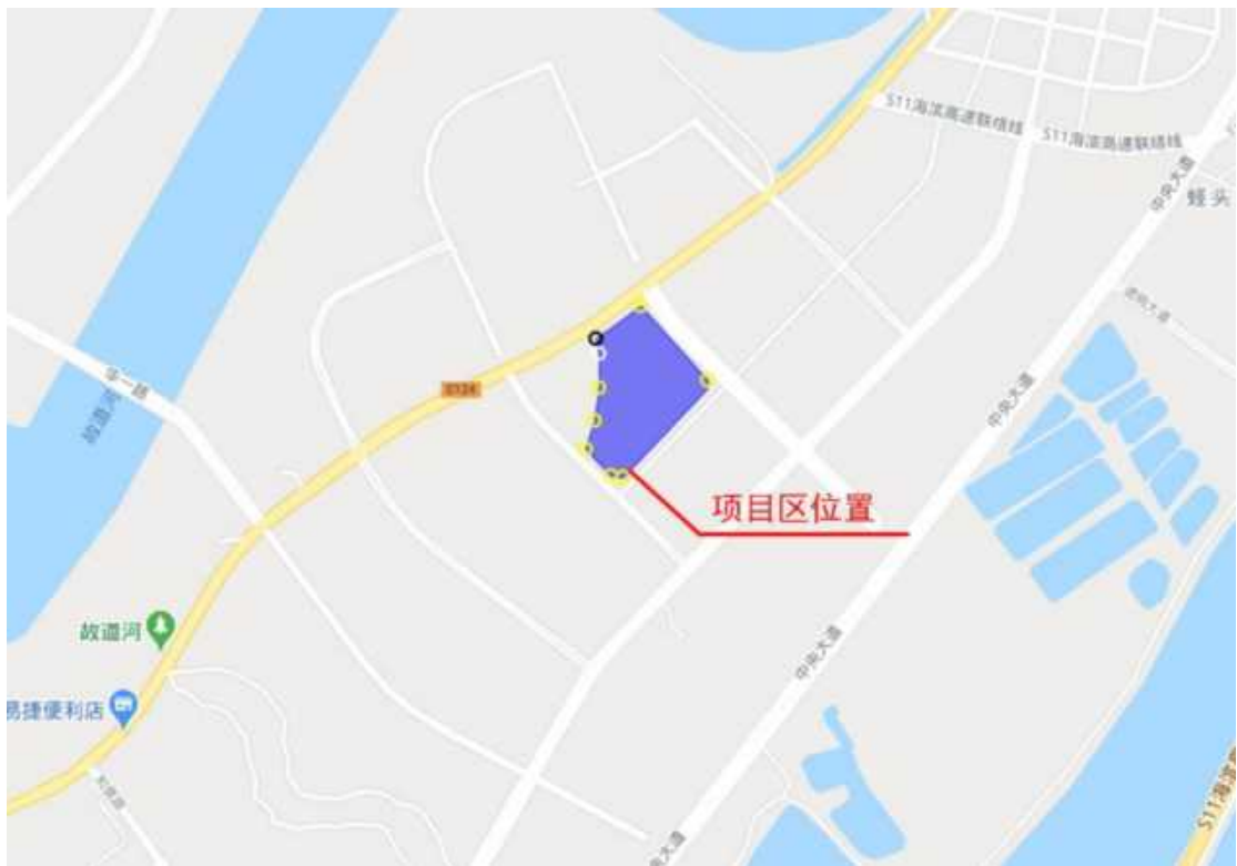
图 1-1 项目地理位置图

天津生态城中部片区 41#地块住宅项目位于天津市滨海新区中新生态城，东至新一街，南至华路，西至中新大道，北至中泰大道。项目地理位置图如下图所示：