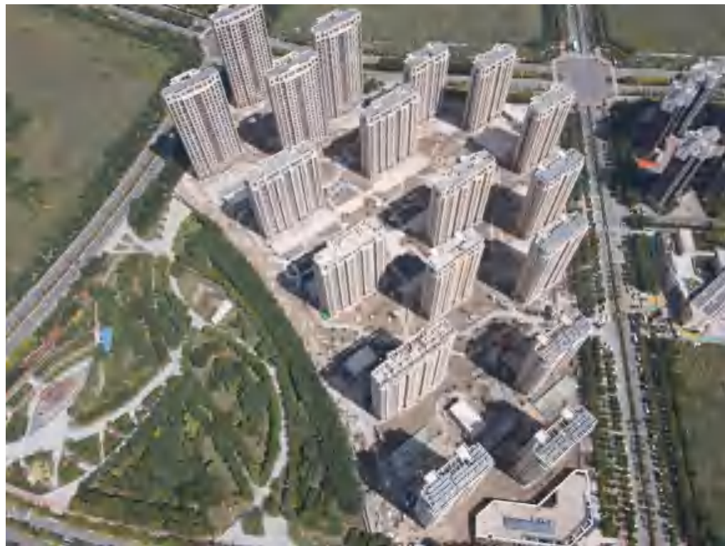
项目建设后影像图