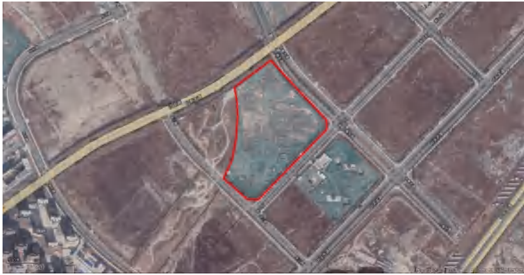
项目建设前影像图